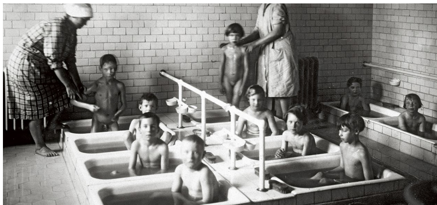
Skolbad i Malmö på 1920-talet.

in med stora rostfria spannar som var fyllda med potatis eller sås. Köttet fanns vanligen i stora stekbackar. Med en stor skopa portionerades maten ut och det var bara att varsko ifall man ville ha påfyllning. Det ville man gärna. Dörrvakterskan posterade också vid skräpspannen och skickade matvägrarna tillbaka till bordet. När det var fisk på menyn kunde vi allätare promenera i lugn och ro till bespisningen. Den ordinarie matstyrkan var starkt reducerad och en sådan dag fick alla plats med en gång. Personalen frestade med goda efterrätter för att locka icke fiskätare, men det hjälpte föga.