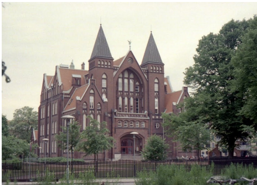
Tuppaskolan i Landskrona.